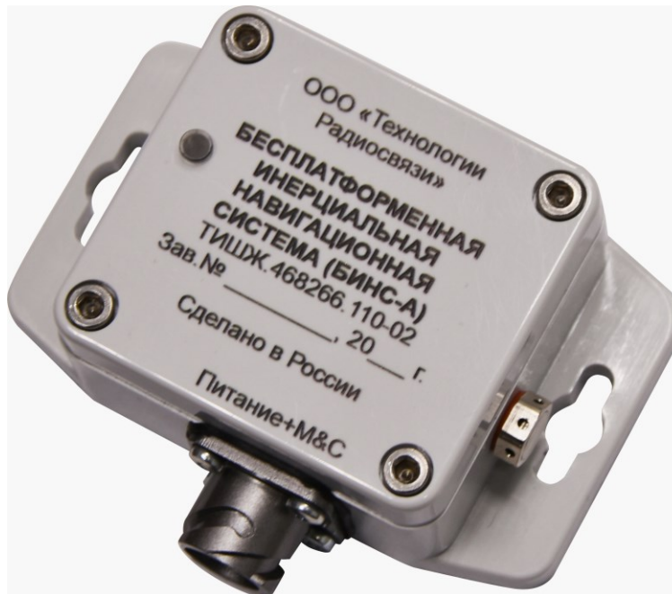
Рисунок 1.1 – Внешний вид БИНС-А

1.1.3.2 На блоке БИНС-А расположены соединители, представленные в таблице 1.2.